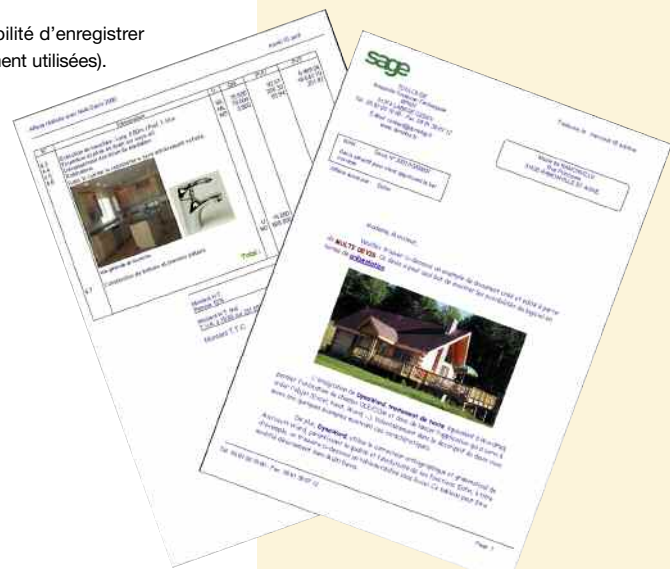
Des documents client personnalisés.

Pour plus d'informations : www.sage.fr ou 0825 825 603