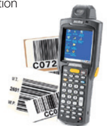
Lecteur portable et étiquettes codes à barres