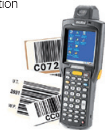
Lecteur portable et étiquettes codes à barres