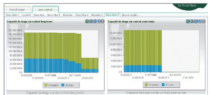
Portail Sage capacité de tirage