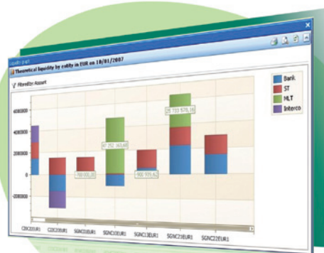
Position de la trésorerie nette