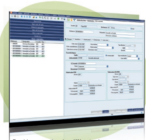
Des biens amortis selon différents plans d'amortissement, acquis ou sous contrat de location-financement

Les nouvelles dispositions légales sont appliquées par de simples mises à jour du logiciel : une démarche qui optimise la mobilisation de vos équipes informatiques et comptables.